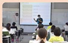
1. 日期：110年5月15日 主題：特教生融合教育 (國際生融合教育)——視障生融合學生的 閱讀教學 主講人：國立宜蘭大學特殊教育學系李永昌教授。