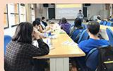
3. 日期：110年5月15日 主題：臺東縣特教輔導分區研習——臺東市區 (由新佳 國中協助辦理)——學區內特教生融合教育 主講人：國立宜蘭大學特殊教育學系李永昌教授。