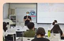
5. 日期：110年5月15日 主題：特教生融合教育 (國際生融合教育)——視障生融合學生的 閱讀教學 主講人：國立宜蘭大學特殊教育學系李永昌教授。