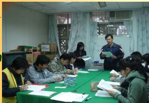
畢業生12年安置(轉銜)