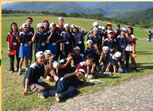
身障生童軍露營活動