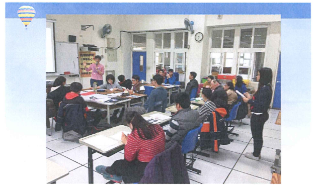
透過全方位課程設計教材，提昇學生性別 意識，在彰特試教1週，中特實施10週 8