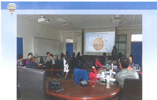
辦理北中南家長座談會